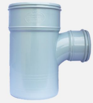
سه راه تبدیلی ۸۷/۵ درجه