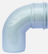
زانو ۸۷/۵ درجه