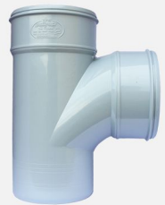
سه راهی ۸۷/۵ درجه