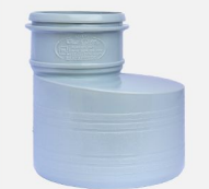
تبدیل غیر هم مرکز