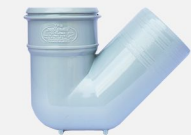
سیفون ۱۳۵ درجه