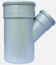
سه راه تبدیلی ۴۵ درجه