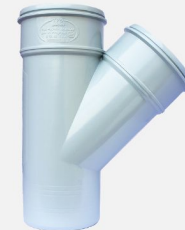
سه راهی ۴۵ درجه