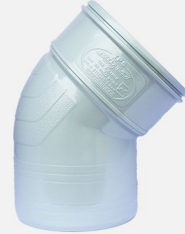
زانو ۴۵ درجه